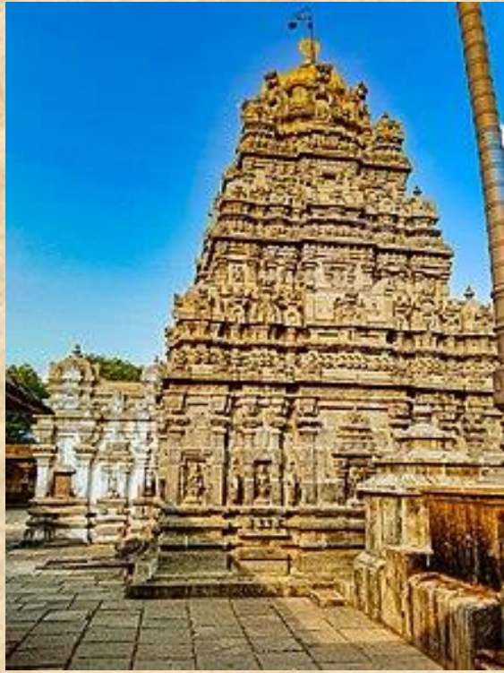
Sri Koormam Temple