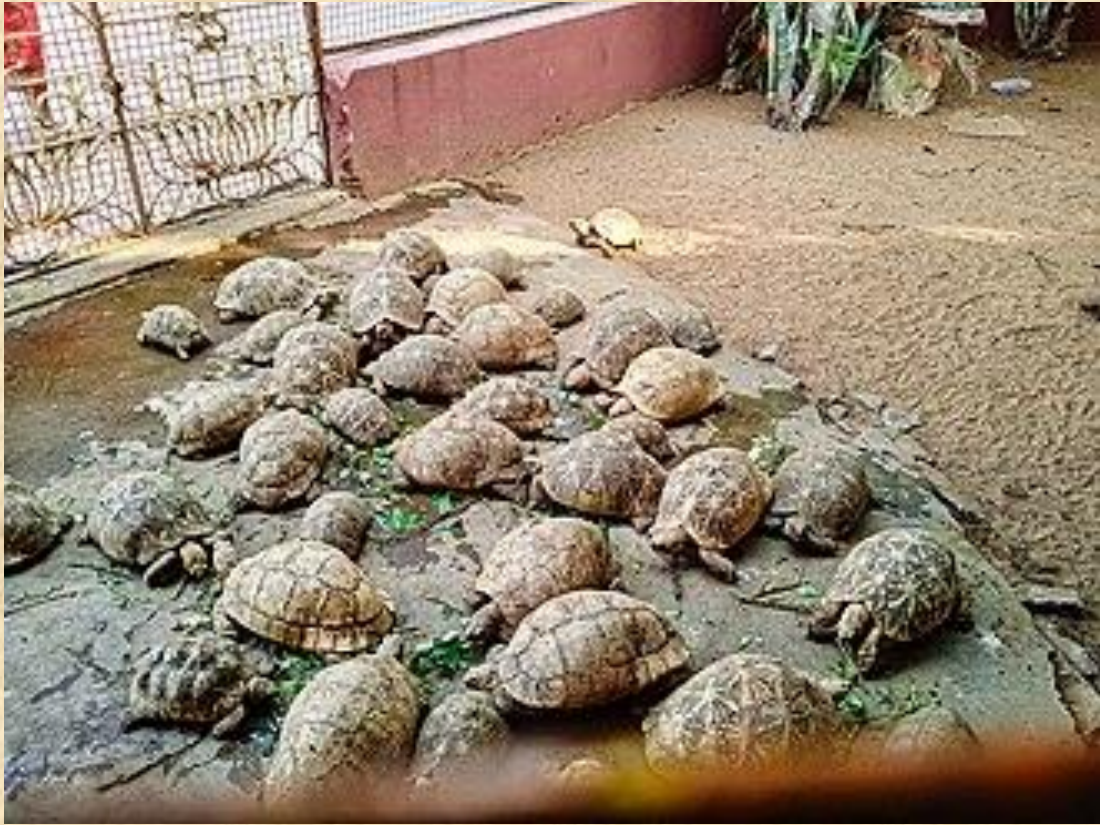
Live tortoises in the Kurmanatha Swamy temple's premises, its preservation efforts