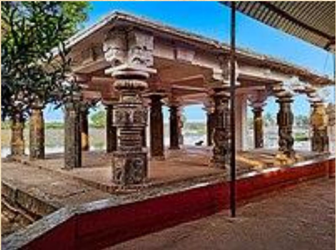
Sri Koormam Temple