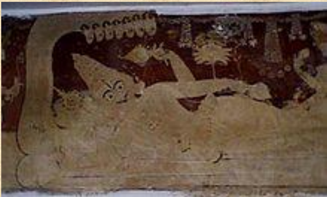
One of the mural paintings in the temple, featuring Vishnu as Ranganatha